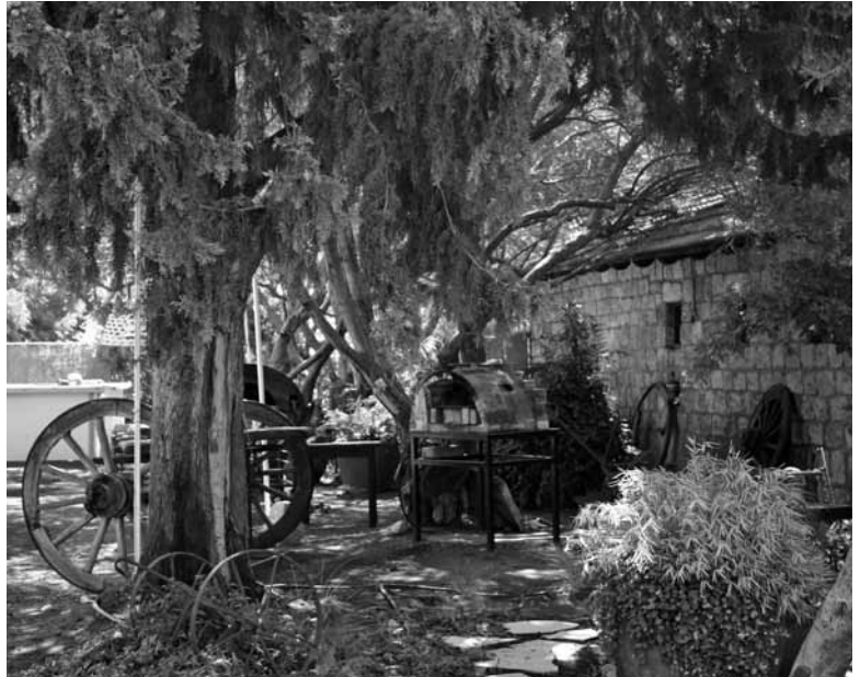
אחות דוברובין, אחת החוות החקלאיות הראשונות שהוקמו בעמק החולה על ידי גרים מרוסיה (ספטמבר 2012)

גם האיכרים במושבות שניהל קלווריסקי מתחו עליו ביקורת. הביקורת נבעה בחלקה מאישיותו; אופיו הסוער והלעומתי ודרישתו לצמצם את היקף נחלותיהם הובילו לא אחת לסכסוך עמם. אולם עיקר הביקורת היה נעוץ בנטייתו של קלווריסקי לעודד את התיישבותם של גרים על האדמות שרכש, ביניהם גרים מהקווקז ומגאורגיה וגרים