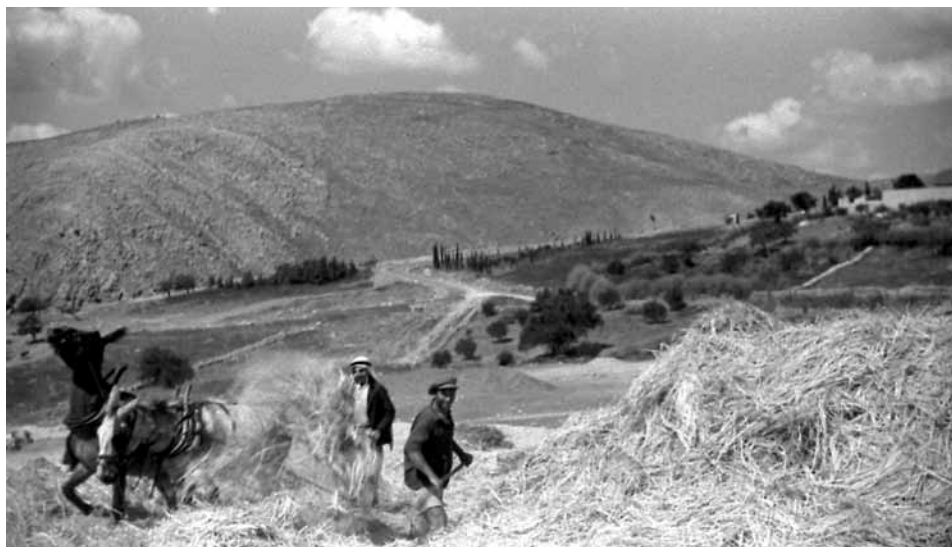
חקלאי יהודי ופלאח ערבי בגליל עובדים יחדיו בגורן בזרייה לצורך הפרדת הבר מהתבן

אותן, בשם יק"א; תכנן את היישובים ודאג ליישום בשיטת האריסות; קבע את התכנית המשקית; וכן קבע את נוהלי היחסים בין המתיישבים לפקידות. קלוורסקי אף הכתיב להנהלת יק"א בפריו תנאים הכרחיים לכיסוס היישובים ולרווחת המתיישבים, כמו הקמת בתי כנסת, מקוואות ושירותי בריאות – בניגוד לעמדת הנהלת יק"א, שחפצה לצמצם את הוצאותיה ולהטיל על כתפי המתיישבים את הקמתם ותחזוקתם של השירותים הציבוריים במושבות. 43 בכך יישם קלוורסקי הלכה למעשה את מדיניותה של יק"א ליצירת התיישבות חקלאית נרחבת ורצופה וגם את החזון הציוני, שדגל במימוש הלאומיות היהודית באמצעות שיבת העם לארצו ושינוי פירמידת התעסוקות שלו.