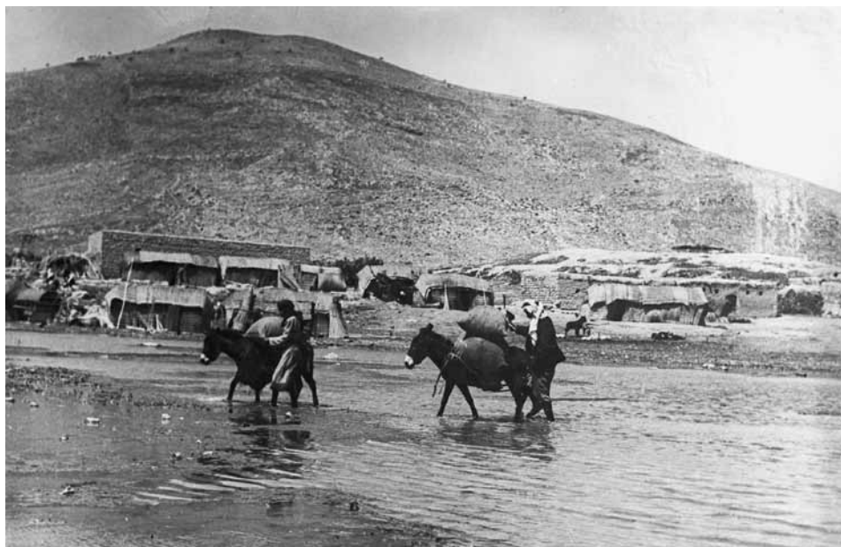
כפר ערבי סמוך לאגם החולה, שנות השלושים של המאה העשרים