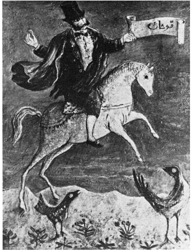
הברון רוטשילד אוחז קושאן (איור: יוסל ברנט, באדיבות גלריה דן, תל-אביב)

כך היה למעשה התשלום הכפול למדיניות לא רשמית לרכישת קרקעות שנקטו כל הגורמים המיישבים הציוניים. יש לציין שקלווריסקי היה יכול לנהוג ברוחב יד ולפצות את האריסים הפלאחים מפני שיק"א נהגה בכבוד באוכלוסייה הערבית, במיוחד בפלאחים, והכירה בזכויותיהם, שנבעו בין היתר מהעובדה שחלקם ישבו דורות רבים על הקרקעות שמכרו האפנדים לחברה. לפיכך תמכה יק"א עד גבול מסוים במתן פיצוי לאריסים בשיטת התשלום הכפול. החברה גם המשיכה להעסיק חלק מהאריסים לאחר רכישת הקרקעות מהאפנדים; מובן שהדבר התפרש, ובצדק, כביטוי ליחס חיובי לערבים, אולם האדם פעלה כך גם משיקולים כלכליים – כוח האדם הערבי היה זול, מיומן ומנוסה יותר מהמתיישבים היהודים בעבודות החקלאות, והעסקתו התיישבה עם מדיניות החברה, שחתרה לרווחיות ולאחסכון בהוצאות. 61