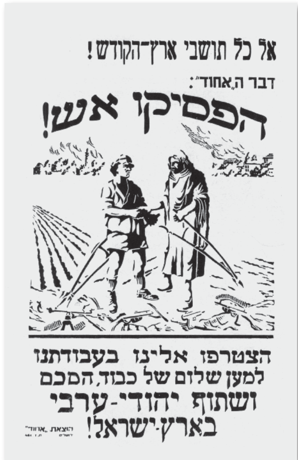
כרזה שפורסמה ב'בעיות הזמן', ביטאון 'אגודת איחוד' שייסד מאגנס, ושקלווריסקי היה פעיל בה. הכרזה מבטאת את חזון האגודה ('בעיות הזמן', ניסן תש"ח)