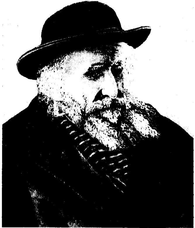
הרב שמואל סלאנט

אחריהם. 57 במאמר שפורסם חודשים אחדים לאחר עלייתם של מתיישבי פתח־תקוה על הקרקע, מתאר הוא את דמות המתיישב האידיאלי בעיניו: אדם בעל אופי, משכיל, ירא־שמיים, נלהב ומסור לעבודתו, אבל יחד עם זאת שוקל צעדיו במתינות ואינו קל להתפתות לשיקולים של נוחיות ורווח כספי מהיר. לדעת פינס, רק שילוב מאוזן בין תורה, סבלנות, מסירות והתלהבות עשוי להבטיח את הצלחת מיפעל ההתיישבות בארץ־ישראל. 58 במאמרו זה, שהוא אחד המאמרים הראשונים שכתב בירושלים, משבח פינס את מתנחלי פתח־תקוה, ויואל משה סלומון בראשם. 59