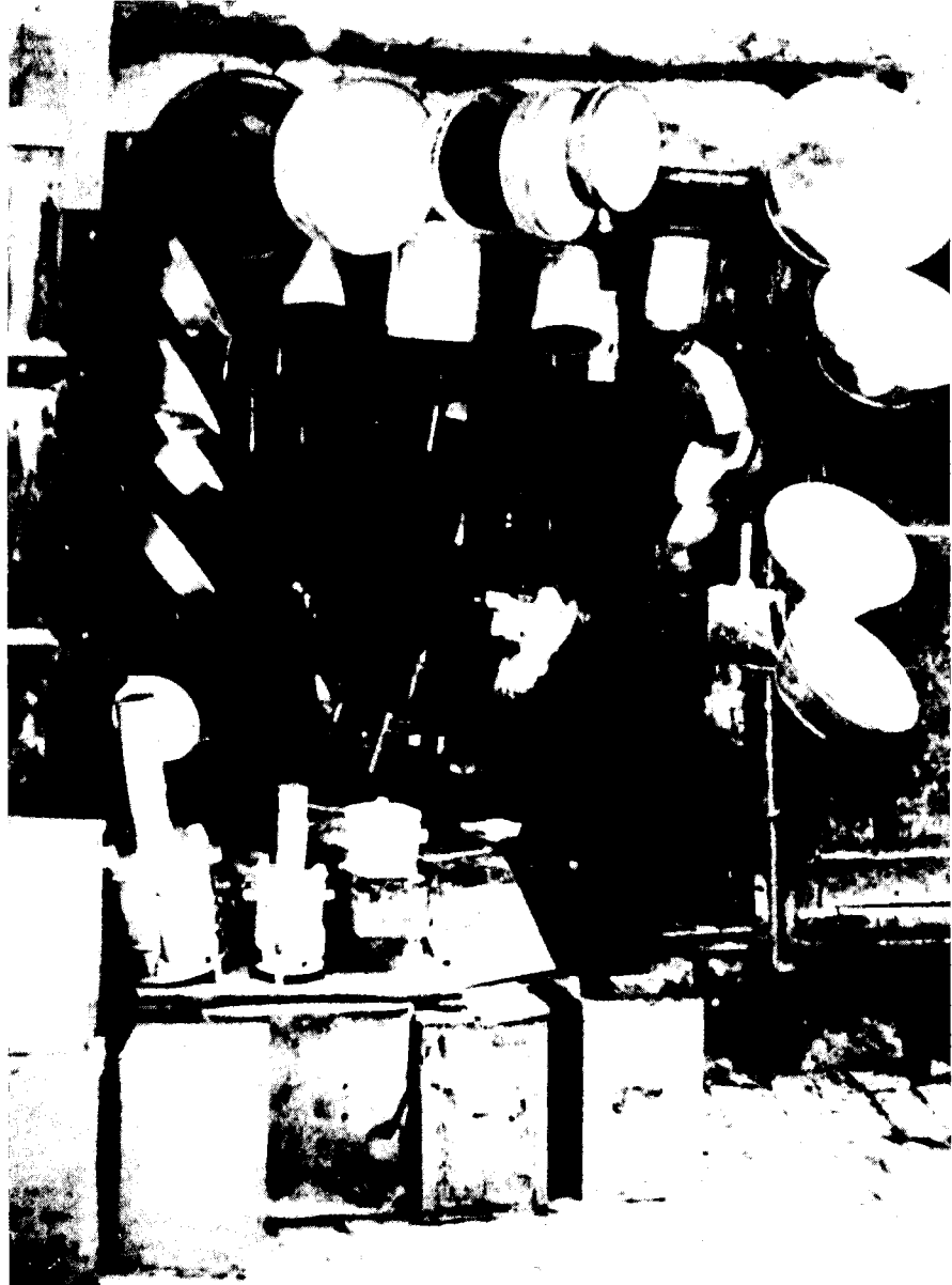
פחח יהודי בעיר העתיקה, שנות השבעים של המאה הי"ט

יהודי ירושלים באור שלילי, אך לא היה בכוונתו להעליבם אלא לעשות לטובתם ולרווחתם. 53 הוא לא שלל את קיומו של ציבור לומדי-תורה בירושלים; אדרבה, בחברה יהודית מתוקנת יש מקום לכל גילוי תרבותי, כל זמן שהגילוי, או אורח החיים של יהודי ירושלים, יקום ביחס נכון לגילויי תרבות וחברה אחרים בחיים היהודיים. אולם הוא התנגד לקובעים מראש, שצורת החיים הקיימת בירושלים, במסגרת 'כוללים' מסוגרים שחבריהם מתפרנסים מכספי ה'חלוקה', היא צורת החיים הרצויה, משום שיש בה ערובה לקבלת תרומות ונדבות מיהודי חוץ-לארץ.