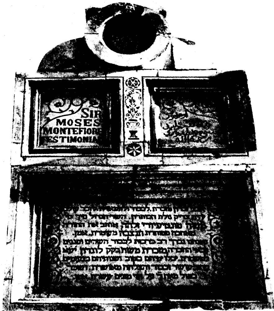
לחזקת קרן מונטיפיורי בשנת תרמ"ג מזכרת השר משה מונטיפיורי בשנת תרמ"ג

ובמערכ-אירופה יפסיקו לשלוח את תרומותיהם, ובשום פנים לא רצה לשאת באחריות למעשה זה. 82 וכאשר שאל עורך 'המליץ' את פינס במכתב גלוי על תכניות הקרן ועל פעולותיה לעתיד, 83 ביקש ממנו פינס להפסיק תחילה את דברי ההסתה שהוא והעיתונאים האחרים מפרסמים נגד החרדים בירושלים, כמבקשי טובתו וכבאים להגן עליו. 84 חילוקי הדעות הממושכים בין פינס, כבא-כוחה של קרן 'מזכרת משה מונטיפיורי' לבין קנאי ירושלים, הביאו את חברי הוועד הפועל של הקרן להכיר בטעותם ולהחליט שלא להכריז יותר על ייסוד בתי-ספר מקצועיים בירושלים, כפי שאכן דרש פינס. תחת זאת הם