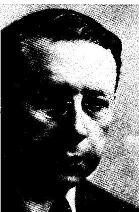
שמואל טולקובסקי (1886-1965)

כסודי. סיווג זה הוסר רק לאחר 40 שנה, ב־1961, ואז הותר המכתב לפרסום. בעת ההתרחשויות עצמן נשלח המכתב לתיק, 9 ימים בלבד לאחר שהגיע לוּושינגטון.