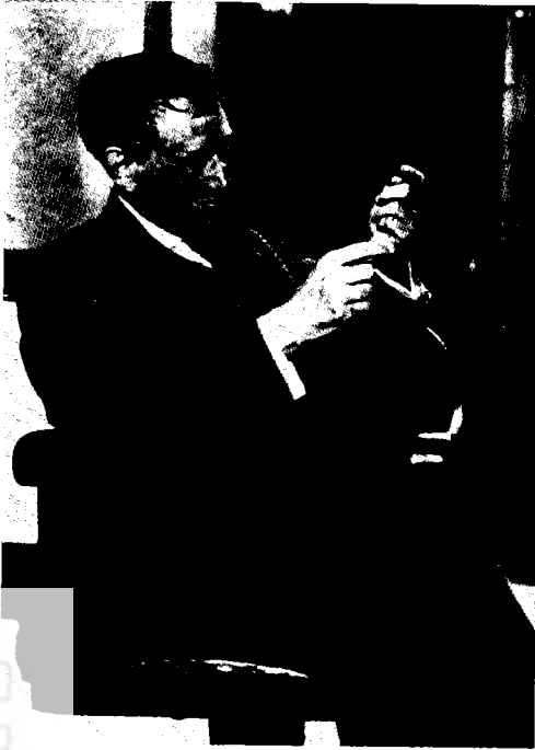
השופט לואי ד' ברנדייס (1856-1941)

ירושלים. 17 אף כי אין עדיין כל דיווח רשמי, 'מקורות לא רשמיים דיווחו כי פעולתו של מסית בקרב הערבים עוררה אותם לתקוף את היהודים, וכל העניין נחשב כחלק מתוכנית כללית, שמטרתה למנוע מהיהודים לחזק אחיזתם בארץ-ישראל'. נוסח זה מצביע בבירור כי המקורות הבלתי רשמיים היו חוגים ציוניים, שהעבירו בדרך זו את גרסתם לווינגטון. תוכנו של מברק זה הועבר ב-15 באפריל ממשד המלחמה למחלקת המדינה ונתוסף על המידע שהצטבר.