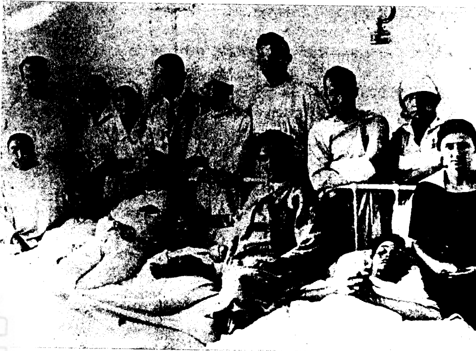
פצועי המאורעות, תל-אביב, מאי 1921