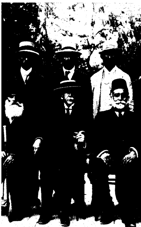
קונסול ארצות-הברית, ד"ר אוטיס גלייזברוק, עם חברים בוועד הסיוע, ירושלים, 1915 (קטע מתצלום)