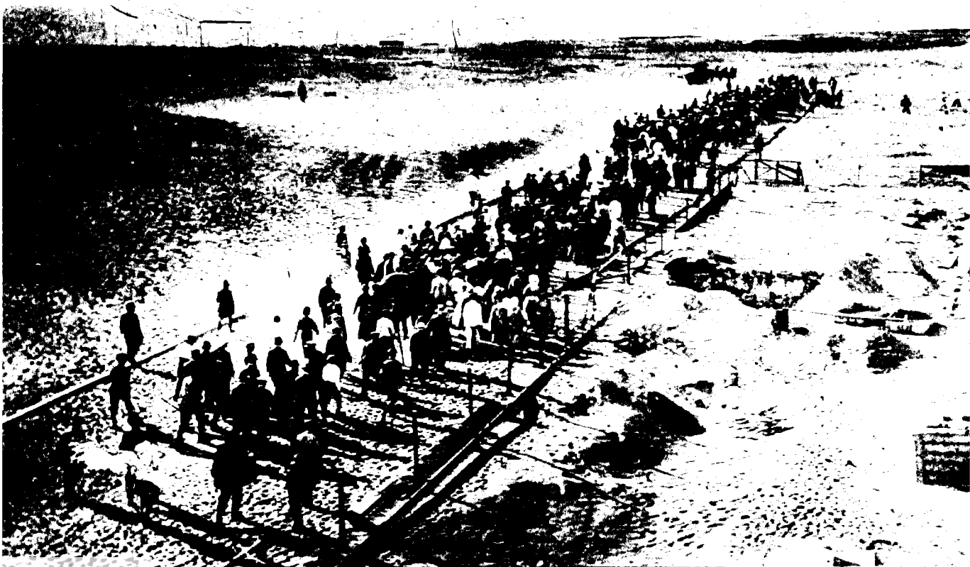
ההלוויה של קרבנות הפרעות לבית-הקברות (כיום ברחוב טרומפלדור), תל-אביב, מאי 1921