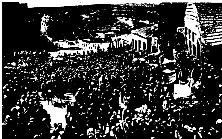
פרעות תר"פ-תרפ"א: התקהלות המון ערבי ברחוב יפו וליד שער יפו, ירושלים

אירוע חריג בארץ-ישראל; בשני – נועד לקונסול האמריקני בירושלים, כמו לנציגים אמריקנים אחרים באזור, תפקיד נוסף. במרוצת האירועים ובמשך כל הימים שבאו אחריהם, שימשו הנציגויות האמריקניות כלשכות קשר בין המשלחות הציוניות האמריקניות ששהו בארץ לבין הנציגויות והאישים הציוניים בארצות הברית. הממשל הצבאי הבריטי ניסה לעכב את פרסום המאורעות ובעיקר את מהלכם האמיתי, ולכן הפעיל צנזורה קפדנית על כל דיווח שיצא מהארץ ולא תאם את הגירסה הרשמית. 8 הגירסה היהודית נתפרסמה בעיתונות הלונדונית העצמאית רק ב-13 באפריל, 9 ימים לאחר תחילת האירועים, אולם – כפי שיוצג בהמשך – ניתן היה לפרסם את הידיעה עוד קודם לכן. התנועה הציונית ניצלה את קשריה הטובים עם הנציגים האמריקנים השונים במרחב והשכילה לעקוף את הצנזורה הצבאית הבריטית ולהעביר מידע מדויק ומפורט דרך נציגים אלו, שדיווחיהם לא צונזרו, כמובן, על ידי הבריטים.