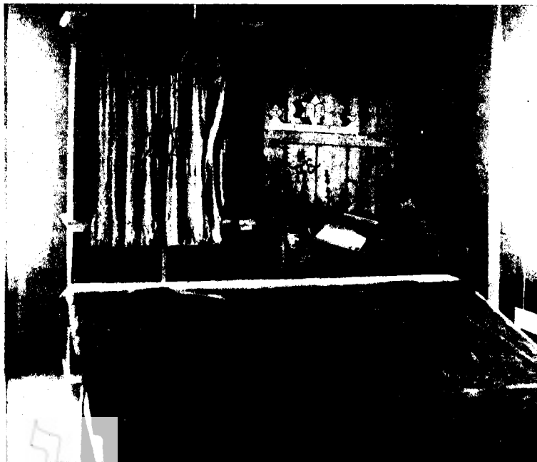
בית הכנסת במושב חיטין

בחצר ונראה והנה ספרדי עומד ושופך שמן על בנדים יקרים ששרפו לכבוד רבי מאיר, והנה נשפך כל השמן וההדלקה החלה, הדליקו את הבגדים והעשן עלה, ואש להטה ותלחך את הבגדים. נמרה ההדלקה ואנחנו נסענו הביתה. בדרך שרף כל העגלות נסעו ביחוד, עד שהגענו למושב ואז הלכנו הביתה.