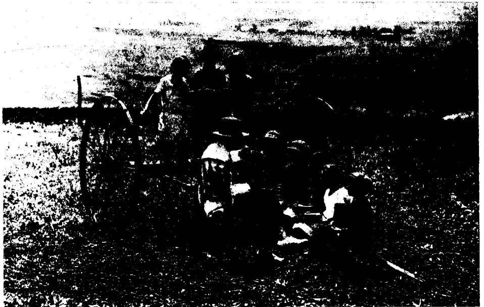
שיעור בשדה, ליד מגוב, עם המורה מייסטר (מאחור באמצע – בעלת היומן)

בידיו. עלינו על ההר וכל אחד הלך לעבודתו, ואני הלכתי הביתה ואקח את הילקוט ואלך לבית-הספר. ובבית-הספר למדנו שירה 42 ואחרי-כן התעמלות. גמרנו את ההתעמלות ובהפסקה לא קרה שום דבר ואחר-כך הלכנו הביתה. לפנות ערב הלכנו לקטף פרחים. הבאנו ארבעה סלים מלאים והילדות הגדולות הלכו לעשות לנו זרים.