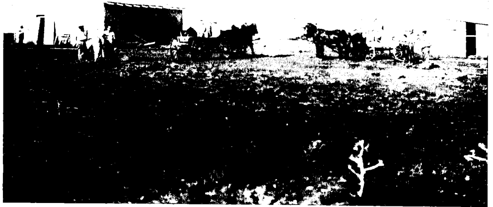
ימים ראשונים (1924)