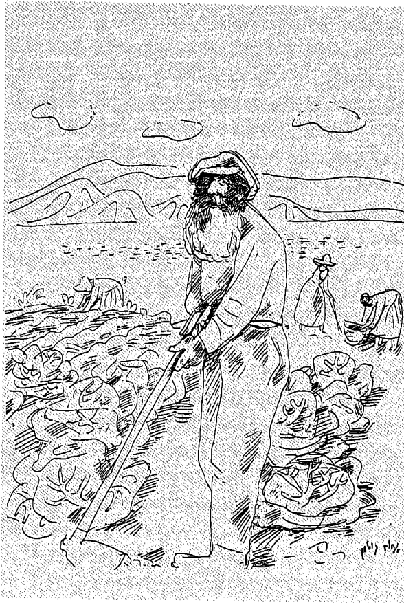
גורדון בשדה – רישום של נווים גוטמן

הלאומיות המקורית. גורדון סבור, שעליבות בתיהם וכפריהם של ערביי ארץ-ישראל היא ביטוי לכך, 'כי בני האדם היושבים פה אינם מבינים את הטבע הארצי-ישראלי, כל-כך הם רחוקים ממנו! כל-כך שונים הם ממנו!', 'וכל חוסר התרבות והישימון מעידים', ממשוך הוא ואומר, 'כי האדם המקומי לא התרומם למדרגת הטבע הארצי-ישראלי'. 38 פירושה של דברים אלה הוא שהנופים דלי המראה שיוצרים ערביי ארץ-ישראל, נופים שמתגלה בהם אי-יכולתם למצות את הפוטנציאל של הטבע הארצי-ישראלי, הם מימד בזהותם של ערבים אלה. למעשה הם מימד של פעילות שלא התרוממה למדרגה של לאומיות – כשם שלא כל פעילות בחומרים, בצבע או באבן, מתרוממת למדרגה של פעילות אמנותית. 39 מדברי גורדון עולה בבירור, שהנופים המיוחדים, שיוצרים