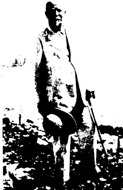
מיכאל פולק על אחת מגבעות 'נשר' (שנות העשרים)

גם התארגנות הפועלים הערבים החלה בחיפה. פועלי רכבת ערבים אשר היו חברים בהסתדרות פועלי הרכבת, הדואר והטלגרף ועזבוה בשנת 1925 עקב קשריה עם הסתדרות העובדים הכללית והמחויבות הציונית שלה, הקימו את הסתדרות פועלי הרכבת הערבים. זו היוותה את הגרעין לארגון הפועלים הערבים — אגודת הפועלים הערבית הפלשתינית, אשר מרכזה היה בחיפה; שם קיימה את ועידתה הראשונה בינואר 1930, ושם התרכזה פעילותה בשנות השלושים והארבעים. 13 בשנים 1922-1923 התרכז מספר הולך וגדל של פועלים יהודים בחיפה ללא מקורות תעסוקה מספיקים. 14 גידול מספר הפועלים היהודים בתנאי תעסוקה מוגבלת יצר מתחים רבים בקרב ציבור הפועלים — מתחים בין פועלים מקצועיים לפשוטים, בין פועלים חברי הסתדרות לפועלים בלתי מאורגנים, בין פועלים אשר התארגנו לקבוצות וקואופרטיבים לבין הבודדים, בין ה'יותיקים' לעולים ובין הפועלים היהודים לערבים. המתח והמאבקים בין הפועלים פרצו, לדברי דוד דה פריס, בעיקר כאשר חברו ביחד אבטלה, עלייה והגירה של פועלים העירה, כפי שקרה בסתיו 1921-חורף 1922 ובתקופה של שיא באבטלה כבאביב 1923. 15 על רקע תנאים אלה ניתן להבין את החשיבות הרבה שבהקמת בית-החרושת 'נשר', מפעל לייצור מלט שאמור היה להיות המפעל התעשייתי הגדול ביותר בארץ-ישראל ולתרום רבות לפיתוח הכית הלאומי הן בתוצרתו, אשר תאפשר מעבר מבנייה כאבן לבניית בטון, והן בהעסקת עובדים רבים.