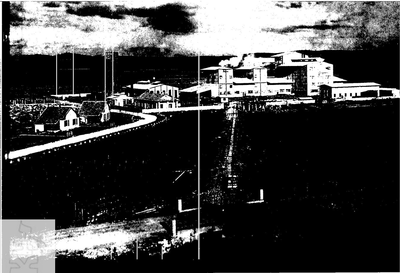
בית-החרושת 'נשר', חיפה (בערך 1930)

בעוד שתי הקהילות היו במידה מרובה קהילות של מהגרים הרי רקע ההגירה, מקורה ודפוסייה היו שונים ביותר. הפועלים היהודים הגיעו מארצות שבהן החל כבר תהליך התיעוש והפרולטריזציה, בין אם היה זה בשלבי המוקדמים יחסית במזרח-אירופה או בשלבים מתקדמים יותר במרכזה. העולים הכירו היטב את שוק העבודה המתועש, את העבודה השכירה ואת איגודי הפועלים. הם היו בעלי נסיון בפעילות תנועתית פוליטית, סוציאליסטית וציונית. רובם היו בעלי השכלה ושאפו לא רק לתעסוקה אלא גם לרמת חיים הוגנת המתאימה לפועל 'בן תרבות' ולמעמד פועלים מאורגן ומבוסס.