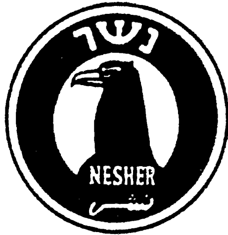
סמל מפעל 'נשר'

לדומיהם. הדומינטיות של עקרון זה בגיבושו של היישוב היהודי עיצבה לא רק מבנים מוסדיים, כלכליים ופוליטיים, אלא אף דפוסי שפה וחשיבה. ההגמוניה של עקרון ההפרדה הקשתה מאוד על אימוץ כל דרך חלופית המבוססת על מידה זו או אחרת של שיתוף פעולה או אינטגרציה. הקושי היה לא רק במימושה של דרך שיתופית הלכה למעשה, אלא אף בהעלאתה על סדר היום החברתי-התרבותי הלגיטימי. ייתכן מאוד כי דרך ההפרדות היתה הדרך היחידה האפשרית לבניית ישות חברתית-פוליטית יהודית בארץ-ישראל. אך בצד ההצלחה היה גם המחיר. ולהערכת הדחיקה המוחלטת כמעט של כל דרך חלופית היא אחד המחירים הכבדים ורבי השלכות.