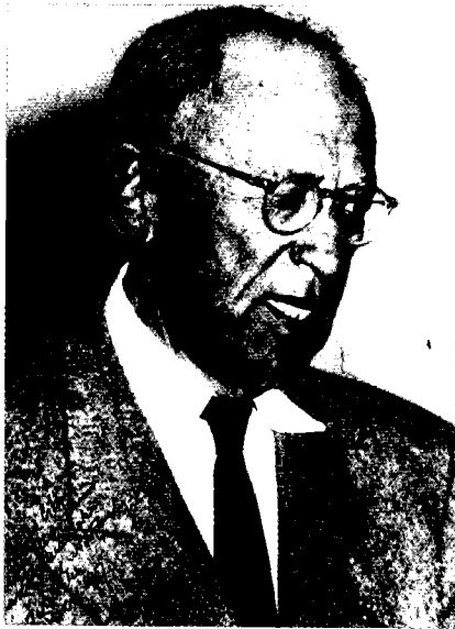
משה נובומייסקי (1961-1873)

וחציים ערבים. עתידה של החברה נראה מבטיח ביותר עד ליום שבו התקבלה החלטת האו"ם לחלק את ארץ-ישראל. 1