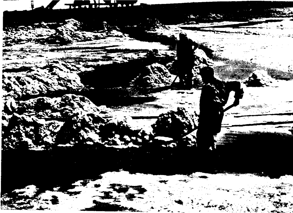
איסוף קרנליט (1944)

רק את החברה במגעים אלה אלא היה גם שליחו של בן-גוריון. הוא חשד שמתוך חשש מתוצאות החלוקה יראה נובומייסקי את תפקידו כמנהל חברה בריטית ויתפשר על חשבון האינטרסים הציוניים.