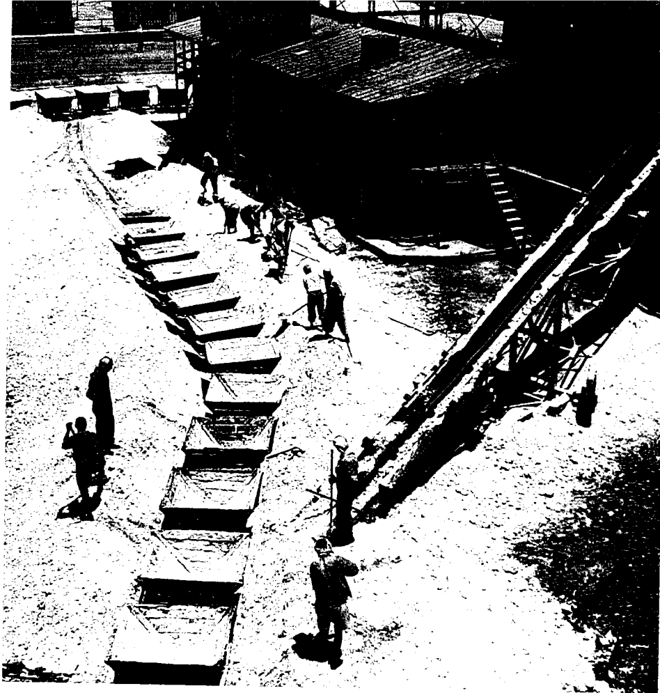
הובלת האשלג בקרונות אל בית- החרושת (1944)