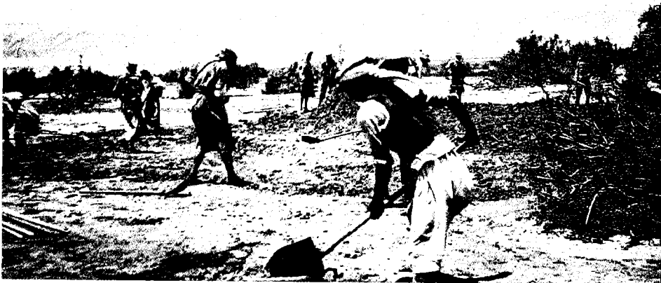
פועלים ערבים מכשירים קרקע לברכות בסדום (שנות השלושים)

בלתי אפשרית. אירועי 13-20 במאי העלו ספקות בדבר נאמנותה ותבונתה של הנהלת החברה, וספקות אלה גרמו נזק למעמדה ולסיכוייה בישראל. באותה עת סיכנו את מעמדה של החברה ספקות דומים מצדה של ממשלת עבר הירדן.