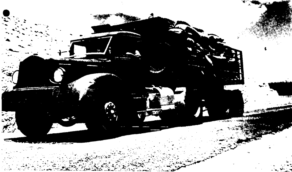
משאית עם שקי אשלג בדרכה מים המלח לירושלים (1946)

חתום יגאל ידין, ראש אגף המבצעים של ה'הגנה'. בשעה 11:00 בבוקר ה-20 במאי דיווח מפקד סדום למפקדת ה'הגנה' שהפינוי הסתיים ללא אבדות בנפש, וכי 'במפעל חיבלו האנשים לפני העזיבה'. 9 פקודת הפינוי, אשר ניתנה באי רצון, משקפת את ההערכה שלא ניתן יהיה להגן על המפעל, וכי עדיף להרוס את המפעל הצפוני מאשר לראותו מופעל בידי זרים או על-ידי חברה שלא תשרת את צרכיה של המדינה היהודית החדשה ולא תהיה תחת שליטתה.