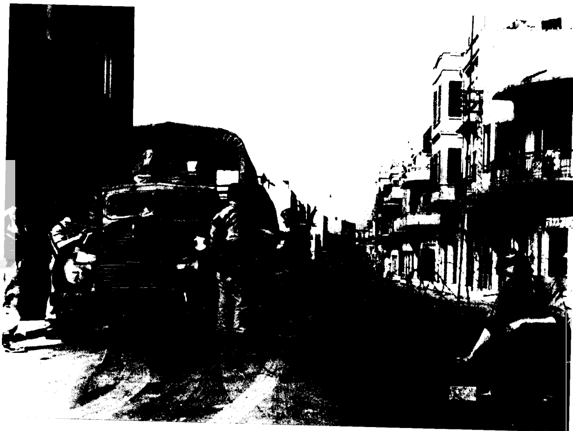
צנחנים בריטיים בפעילות 'כיתור' וחימוש במרכז תל-אביב (יולי 1946)

כל אחת בפיקוד קצין, נכנסו לכל בית ובית ברחבי העיר, בדקו תעודות זהות וחיששו בצורה מדוקדקת מבוקשים חברי הארגון הצבאי הלאומי. המבצע נמשך ארבעה ימים, ובמהלכו נבדקו למעלה ממאה ושניים אלף יהודים. שבע מאות שמונים ושבעה אנשים שנחשדו בהשתייכות לארגון טרור נעצרו ונשלחו למחנה המעצר ברפית. במהלך החיפושים נורו למוות ארבעה יהודים, לכוחות המחפשים לא נגרמו אבדות. 30