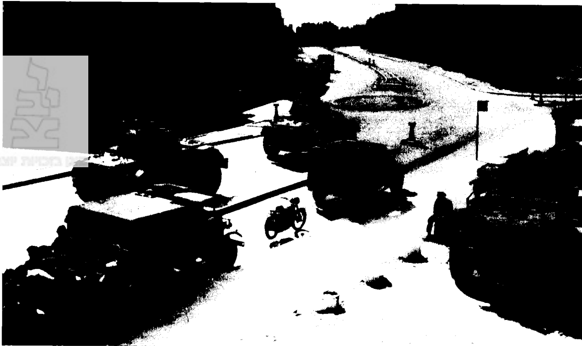
טנקים ומשוריינים בריטיים אוכפים עוצר ברחוב אלנבי בתל-אביב (נובמבר 1945)

למרות הניסיון הקרבי שרכשו אנשי הדיוויזיה המוטסת השישית בקרבות באירופה, הם לא היו מוכנים כלל למאבק שהתנהל באותה העת בארץ-ישראל, ושהיה שונה באופיו מכל מה שהתנסו בו. בתקופה שלאחר מלחמת העולם השנייה אופיין מאבק זה בטקטיקת לוחמה זעירה של ארגוני המרי ביישוב היהודי לצד פעילות פוליטית של התנועה הלאומית הציונית כנגד שלטון המנדט הבריטי. הפיקוד הצבאי הבריטי בזירת המזרח התיכון בכלל ובארץ-ישראל בפרט הניח כי האסטרטגיה שאומצה במאבק כנגד הכנופיות הערביות בתקופת המרד הערבי (בשנים 1936-1939) תצלח גם כנגד ארגוני הטרור היהודיים. הצבא הבריטי לא השכיל להבחין בשוני המהותי בין שני המקרים ואימץ אסטרטגיה בלתי הולמת למאבק בארגוני המרי העברי בארץ-ישראל בשנים 1945-1947. 11