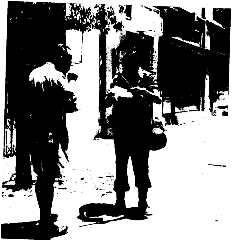
צנחן בריטי בודק מסמכי זיהוי של תושב תל-אביב במהלך עוצר שהוטל על העיר ב-14 ביולי 1946

בעקבות ההצלחה המבצעית שהושגה במאבק כנגד היישוב המאורגן ובעיקר כנגד יחידות ה'הגנה' במהלך מבצע 'אגתה' המשיכה הדיוויזיה המוטסת השישית את מאבקה בארגוני הטרור היהודיים. ביטוי לתפיסת מאבק כזו היו פעולות החיפוש והכיתור בקיץ 1946, שנועדו לתפוס את מפוצצי מלון 'המיך דוד' (22 ביולי 1946). על פי הערכת המודיעין הבריטי הללו הסתתרו לאורך ביצוע הפעולה בירושלים. בעקבות הערכה זו יזם הפיקוד הצבאי הבריטי מבצע סריקה רחב ממדים לאיתור הטרוריסטים מפוצצי המלון. פעולות הסריקה הוטלו על שני בטליונים (השמיני והתשיעי) מן הדיוויזיה המוטסת השישית. ב-23 ביולי 1946 נכנסו צוותי קרב מתוגברים מיתדות אלו לתוככי מספר שכונות בירושלים העברית על מנת לאתר את מבצעי