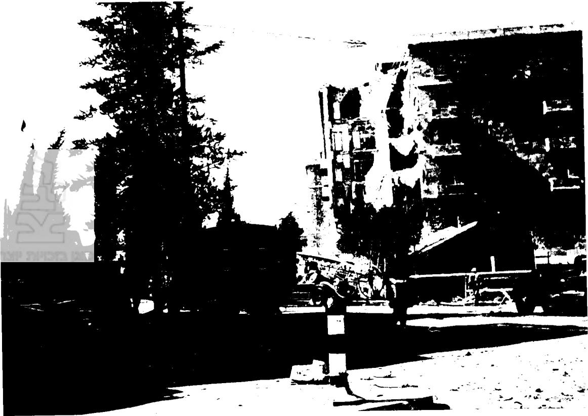
מלון 'המלך דוד' לאחר פיצוץ

יהודי אחד, אחר נפצע, ושלושים ושבעה נשלחו למחנה מעצר, בחשד סיוע לארגוני הטרור. אולם, כעבור מספר ימים, במהלך השבוע האחרון של יולי 1946, הגיעו לפיקוד הצבאי הבריטי בארץ-ישראל ידיעות מודיעיניות מפורטות כי אנשי הארגון הצבאי הלאומי שפעלו במלון 'המלך דוד' בירושלים הגיעו מתל-אביב ושבּו אליה על מנת להסתתר בתום מבצע הפיצוץ. אנשי המודיעין הבריטי העריכו כי באמצעות סריקה מדוקדקת ברחבי העיר ניתן יהיה לעלות על עקבות מפקדת הארגון הצבאי הלאומי, האחראית לפיצוץ המלון. בעקבות מידע זה החליטה מפקדת הצבא הבריטי בארץ-ישראל לכפות לראשונה עוצר מלא בכל שעות היממה על מרחב עירוני נרחב, במטרה לאתר את מפקדות ארגוני הטרור ולחסלן. 29