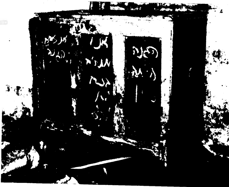
כתובת גיר שהושארה על ידי חברי ה'הגנה' ב'בית הדר', שהיה מטרה לפעילות המחותרות נגד הבריטים: 'הגנה היתה כאן. אנו מתרים בכם לא לבצע את זממכם. "הגנה"'

ב־30 בדצמבר 1946 פעלה הבריגדה המוצנחת הראשונה, בשיתוף הבטליון השמיני (מהבריגדה המוצנחת השלישית) וגדוד חי"ר של ההוסארים (King's Own Hussars), בפעולות סריקה ומעצר חשודים בשכונות התימנים של פתח־תקווה. חיילי הבריגדה המוצנחת השנייה, שאליהם צורפו צוותי קרב ממוכנים מגדוד הרמחים (Lancers) השנים־עשר, חיפשו ברבעים הדרומיים־המזרחיים של נתניה. הבריגדה המוצנחת השלישית סרקה את שכונות התימנים בראשון־לציון. סריקות אלו נסתיימו ללא תוצאות ממשיות. בגל שני של פעולות, במהלך ינואר 1947, נערכו מספר סריקות בשכונת שעריים שברחובות, בשכונת התקווה ובשכונת מונטיפיורי בפרוורי תל־אביב. איסוף המידע המודיעיני למבצעי חיפוש וכיתור אלו נעשה בהנחה שגרעיניו הקשים של האצ"ל נמצאו בשכונות עדות המזרח במרחב גוש דן. הפיקוד הבריטי העריך כי פעולת חיפוש ואכיפת החוק שם תביא לחשיפתם ולמעצרים של מבוקשים ולפגיעה משמעותית בכוחו הצבאי של האצ"ל במרחב התיכון. במהלך החיפושים נבדקו למעלה מתשעת אלפים חשודים, ומתוכם נעצרו כמאה ושלושים איש. אולם מספר העצורים שהוכחה מעורבותם בפעילות המחתרת או השתייכותם לארגון הצבאי הלאומי היה זעום. נתונים אלו הבליטו את חוסר היכולת הטקטית של הצבא הבריטי לאתר את מרכזי הטרור ולעצור את הנהגת תנועת המאבק האנטי בריטית. מנגד המשיכו אנשי האצ"ל בפעילות מבצעית שפגעה בריכוזי הצבא הבריטי ברחבי הארץ. אור ל־3 בינואר 1947 פתח האצ"ל במתקפה על מספר