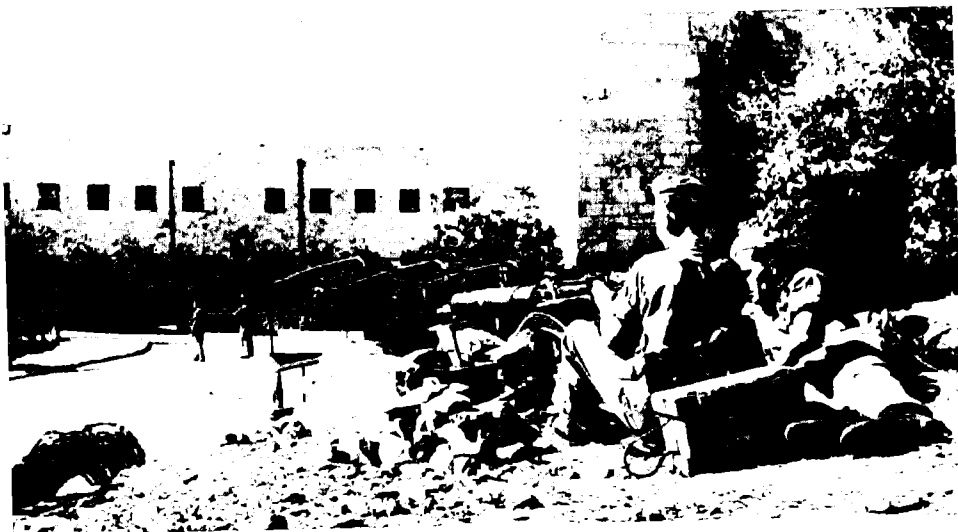
מצור על בנייני המוסדות הלאומיים בירושלים ב'שבת השחורה'

ג. להשתלט על מספר בניינים בתל-אביב שנחשבו כמטה לפעילות ארגונים חמושים בלתי לגאליים; ד. לאסור חברים רבים ככל האפשר של הארגון החמוש הלא חוקי הפלמ"ח. 25 המודיעין הצבאי הבריטי העריך שההפתעה הטקטית המושלמת של מבצע זה הייתה בתדהמה את היישוב היהודי. להערכתו היישוב היהודי ציפה למבצע תגובה על הסלמה של פעילות הפלמ"ח בעיקר ב'ליל הגשרים', מיוני 1946, אולם לא בהיקף ובעוצמה של מבצע 'אגתה'. 26 שלוש הבריגדות של הדיוויזיה המוטסת מילאו משימות מרכזיות במבצע הצבאי המקיף. ההנחיות המקדימות שקיבלו הצנחנים הבריטים היו לזהות אנשים היכולים להימנות עם אנשי הפלמ"ח, ללא קשר לתפקידם או לדרגתם, ולעצדם. בהנחיות המבצעיות שנמסרו לחיילי הדיוויזיה המוטסת הודגש הצורך לשבור את כוחו הצבאי של הפלמ"ח. כמו כן הודגש כי בכל מגע עם אנשי היישוב הנצור אין לחשוש מגילווי התנגדות פיזית מצדם של היהודים. לקצין הממונה בכל חוליית חיפוש ניתנה הסמכות לפתוח באש במצב של סכנה או אם נשקף איום לחייו או לחייהם של אנשי יחידתו. ההוראות ניתנו על בסיס הנחיות של ה'מפקד במקום', ללא צורך בקבלת אישור מדרגים גבוהים כפי שהיה בהנחיות שניתנו למפקדי משנה בדיוויזיה המוטסת במהלך הסריקות המקיפות בתל-אביב ובמרכזים עירוניים אחרים, בשלהי 1945 ובמהלך חורף 1946. 27